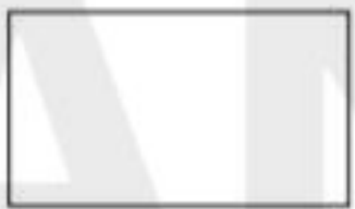
اندازه مجموع اضلاع: