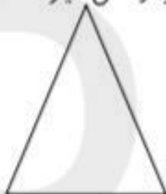
اندازه مجموع اضلاع:

۴. اندازه ضلع های شکل های زیر را بنویسید، در کدام شکل جمع ضلع ها بیشتر از شکل دیگر است؟