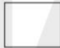
اندازه مجموع اضلاع: